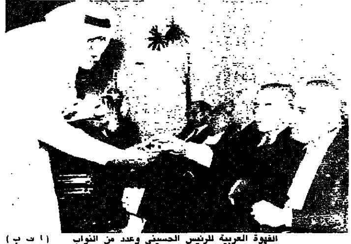
الوفاء العربية الرئيس الحسيني وعدد من الناواب